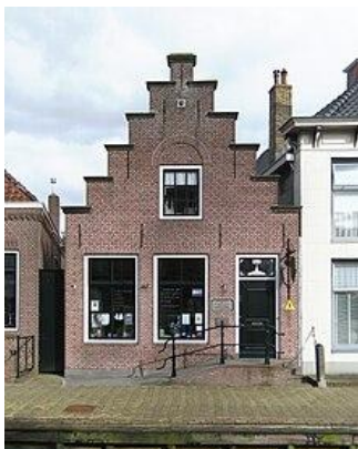
Gysbert Japicxhûs Boarne wikipedia: CC BY-SA 3.0

Gysbert Japiks en syn frou Sijke Nicolai krigen seis bern. Fiif fan 'e seis binne jong stoarn. Suver tagelyk mei Gysbert Japiks, stjer ek syn frou yn 1666 oan de pest. Koart nei harren dea kaam ek harren âldste en iennichst oerbleaune bern Salves te ferstjerren.